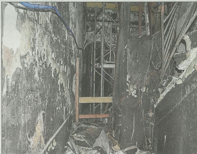
L'état actuel de l'entrée de l'immeuble.

De notre correspondant local, Yves LE FLEM